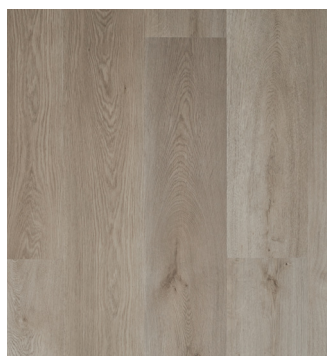
Oregon Oak Varunr.: 155017