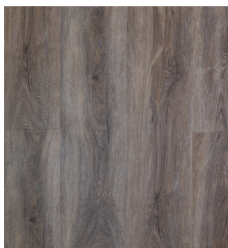
Fashion Oak Varunr.: 155011