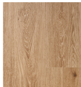
Natural Oak Varunr.: 155026