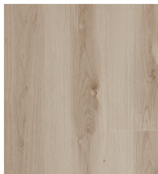
Clayton Oak Varunr.: 155096