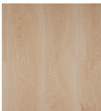
Texas Oak Varunr.: 155028