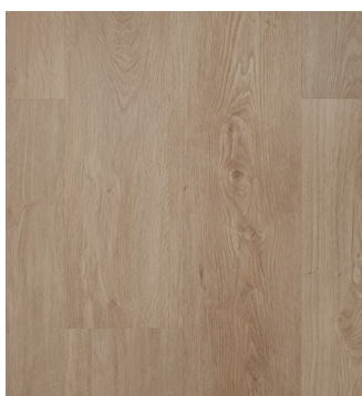
Colorado Oak Varunr.: 155027