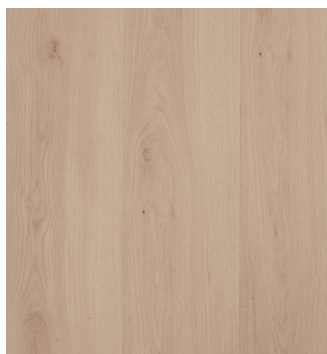
Alberta Oak Varunr.: 155095