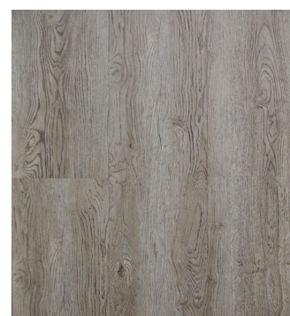
Urban Grey Oak Varunr.: 155032