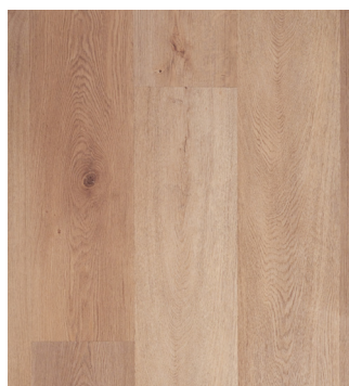
Dakota Oak Varunr.: 155018