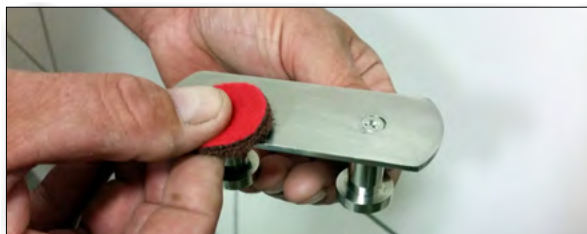
1. Förbehandla ytan genom att rugga av oxidskikt.

Samma princip gäller för övriga beslag ingående i serien Profile Line.