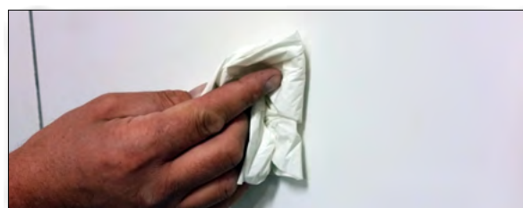
4. Torka ytan ren och torr.