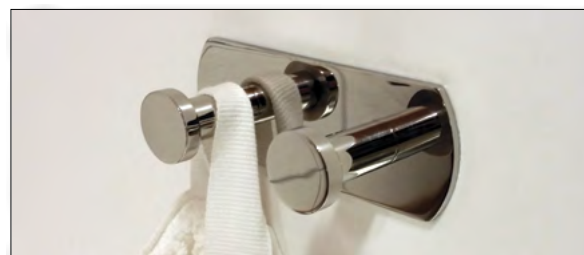
10. Färdig installation! Utan onödiga håltagningar, samt är också möjlig att demontera. Se vidare anvisningar på www.desig4bath.se