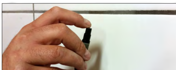
3. Spraya på ytan för infästning. Avlägsnar damm och fett.