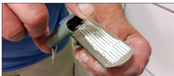
7. Spraya på limmet. Accellerar härdningsprocessen.