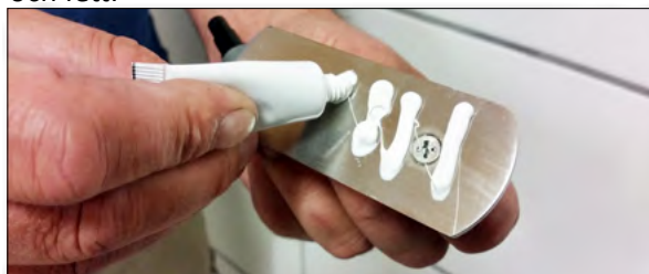
5. Applicera lim på beslaget.