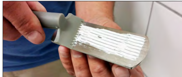
6. Fördela limmet över ytan med tandspackeln.