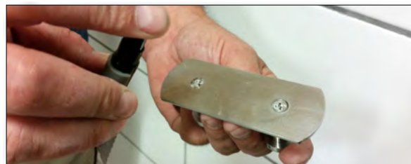
2. Spraya på ytan med medföljande spray. Torka torrrt.