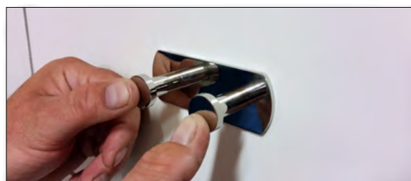
8. Montera beslaget på vägg. Se till att det ligger dikt an väggytan.