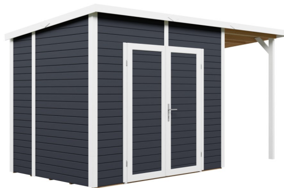
Behandling: ANTRACIT (RAL 7016)