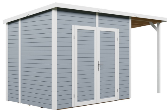
Behandling: LJUSGRÅ (RAL 7001)

Efterbehandling kan utföras i valfri kulör.