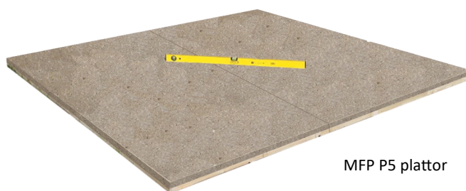
MFP P5 plattor

Behandla golvelementen underifrån, vänd dem och rikta in dem med ett vattenpass.